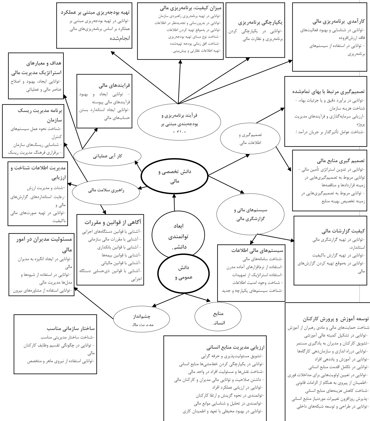
شکل ۴. الگوی مستخرج شده از پژوهش